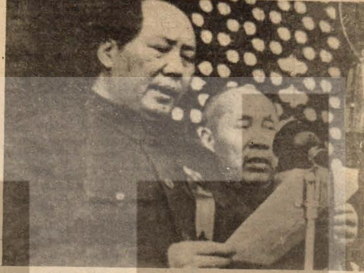
Başkan Mao Zedung, 1 Ekim 1949'da Pekin'deki Tien An Men meydanında, Çin Halk Cumhuriyeti'nin kuruluş beyannamesini okurken.

Bu mücadeleler ve bunları gelecekte izleyecek olan daha niceleri, her geçen gün güçlenen Çin Halk Cumhuriyeti'nin asla bir süper devlet