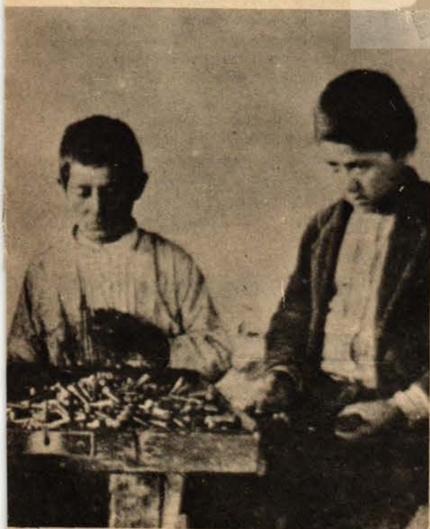
halkımızın fedakarca mücadelesiyle kazanıldı

Troçkist tasfiyeciler ise, bu bakış açısına tepki olarak Kemalist iktidarın en başından itibaren «faşist diktatörlük» olduğunu ileri sürdüler. Bu görüş Marksist ustaların Kemalist diktatörlük hakkındaki tahlilleriyle her zaman olduğu gibi bağdaşmamaktadır. Stalin, Çan Kay Şek'i Mustafa Kemal'e benzetene cevap verirken, M. Kemal'in faşist olmadığını dolaylı olarak belirtiyordu. Stalin, Çan Kay Şek'in «Çin'in Kemal'i olamayacağını» özetle şöyle açıklıyordu: Çin'de toprak devriminin ilerlemesi ile faşist kamp arasında bir orta yol yoktur. Bu sebeple Çan Kay Şek M. Kemal olamayacak ve Çin'in Mussolinileri ile aynı kaderi paylaşacaktır (56). Aynı gerçeği Mao Zedung şu soruyu sorarak belirtmişti: «Çin'in Kemal'i nerede?» (57).